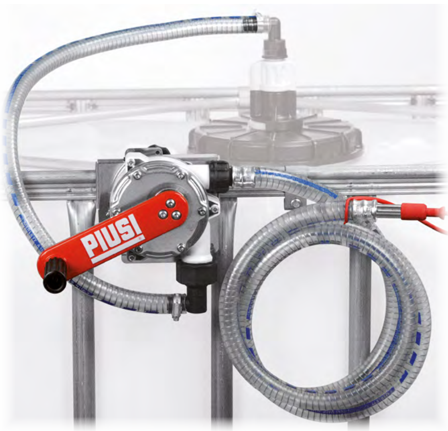
PIUSI HAND PUMP IBC