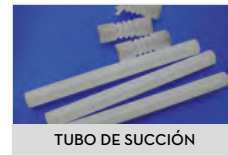
TUBO DE SUCCIÓN