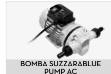
BOMBA SUZZARABLUÉ PUMP AC